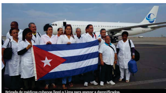
Brigada de médicos cubanos llegó a Lima para apoyar a damnificados.