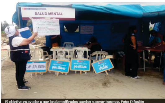
El objetivo es ayudar a que los damnificados puedan superar traumas.