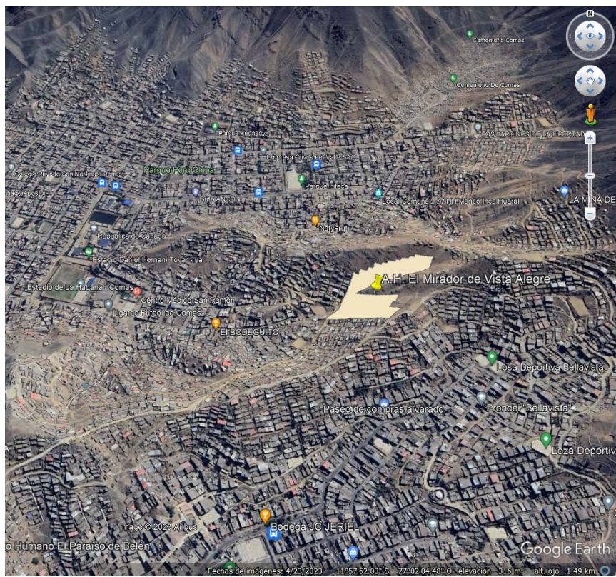
A.H: Mirador Vista Alegre: https://goo.gl/maps/icmKZ7tjbotNkQcJ6