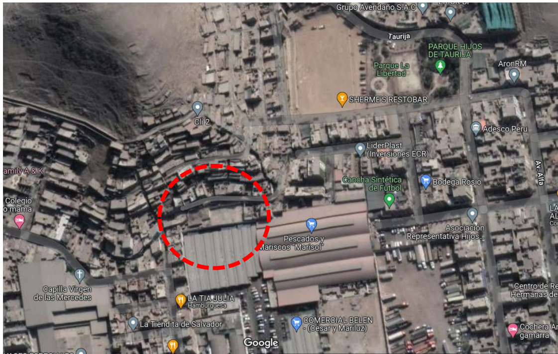
Panel fotográfico del A.H Los Ángeles