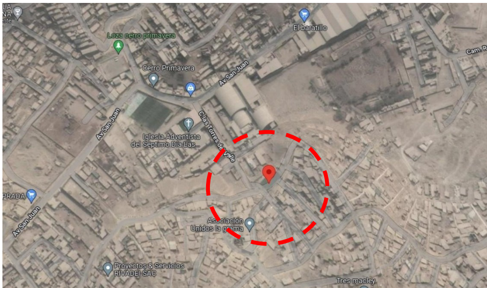
Panel fotográfico del A.V. Unidos La Grama